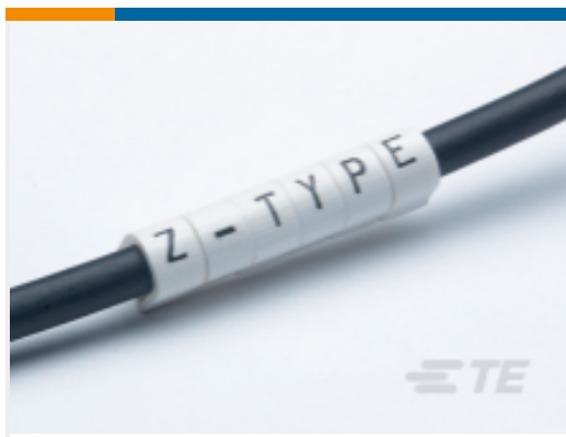
TE 产品编号EJ1954-000 Z-TYPE 推入式标志