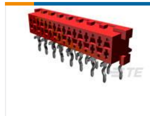
TE 产品编号8-215460-6 MICRO-MATCH FSID P