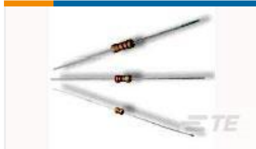
TE 产品编号2-1623931-9 CFR25 5% 3R9