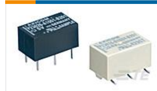
TE 产品编号2-1393774-0 V23026C1051B201