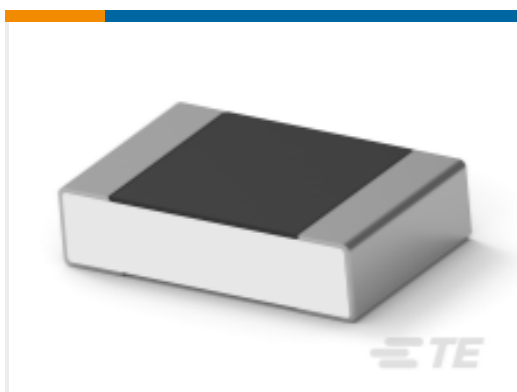
TE 产品编号2-2176373-6 RQ 0805 18R2 0.1% 10PPM 1K RL