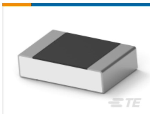
TE 产品编号4-2176373-1 RQ 0805 26R1 0.1% 10PPM 1K RL