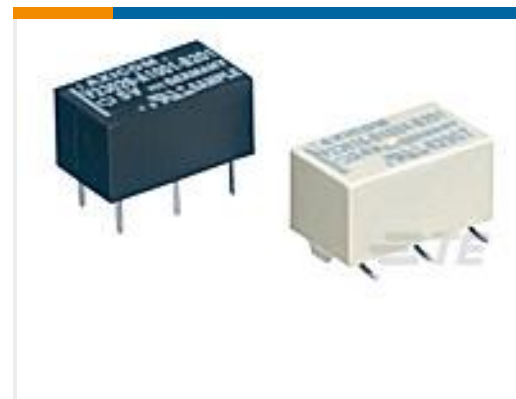
TE 产品编号1-1393774-7 V23026A1006B201