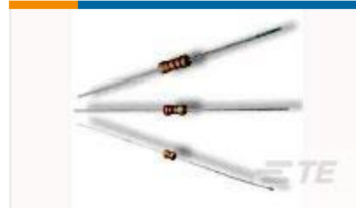
TE 产品编号8-1623931-4 CFR25 5% 8R2