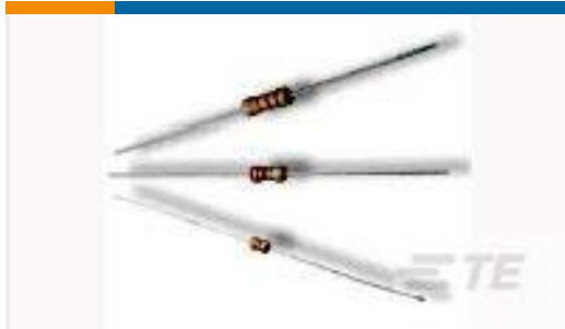
TE 产品编号1-1623931-9 CFR25 5% 39R