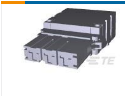
TE 产品编号1473668-1 KIT D-5 (D-5 DYNA-CLAMP 3P)