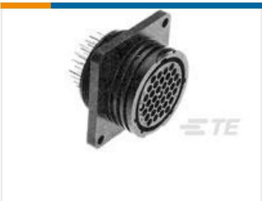
TE 产品编号1-213928-1 CPC PSTD RCPT ASSY SZ 20-14 LF