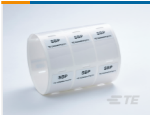
TE 产品编号CM9614-000 SBP 自层叠乙烯基标签