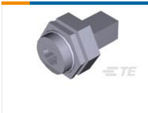
TE 产品编号1546413-3 ETHERNET RJ-45 BLKHD PASSTHRU