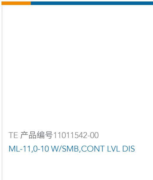
TE 产品编号11011542-00 ML-11,0-10 W/SMB,CONT LVL DIS