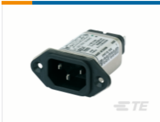
TE 产品编号1-6609006-7 CORCOM EEJ 系列 IEC 滤波插口