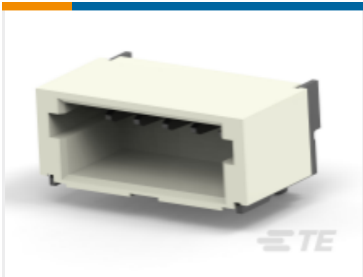
TE 产品编号1734709-2 AMP HPI 1.0MM 接头