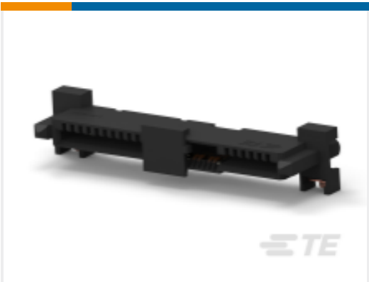
TE 产品编号1735104-1 PT30 XFP 连接器