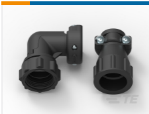
TE 产品编号1-206062-4 CPC 电缆固定夹