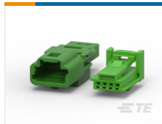
TE 产品编号1473672-1 TH/.025 连接器系统, 壳体