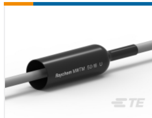
TE 产品编号042304-000 中厚壁热缩管