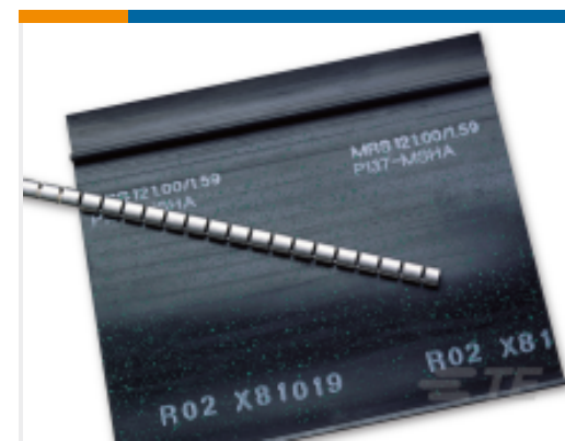
TE 产品编号356036-000 MRSM-73/38-600/239(S5)