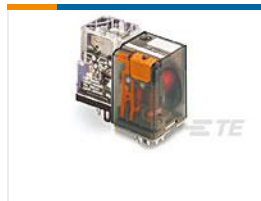
TE 产品编号1-1393092-8 MT333024