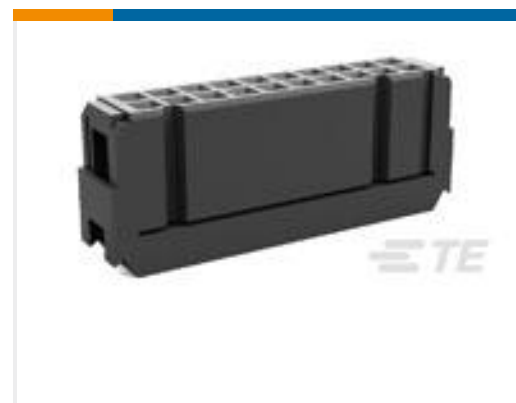
TE 产品编号1658620-1 10 NOVO MIL 15DP, LEAD FREE