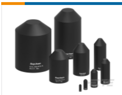
TE 产品编号286711N002 102L 热缩端盖