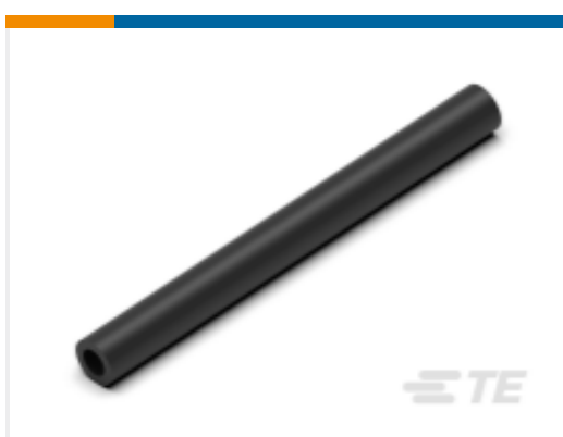
TE 产品编号E39402-000 EN-CGAT-6/2-0-SP