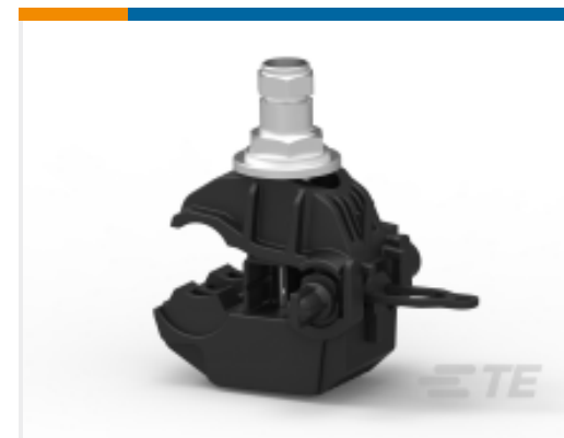
TE 产品编号1727912-3 EP TYPE 绝缘穿刺连接器