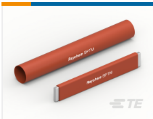
TE 产品编号398451-000 母线热缩管高达 24 kV