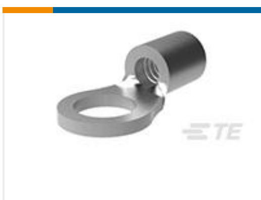
TE 产品编号8-322454-2 TERMINAL,SOLIS R 12-10 8