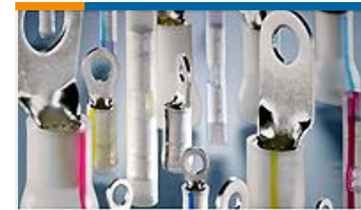
TE 产品编号53963-1 TERMINAL,PIDG PVF2 R 16-14HD 4