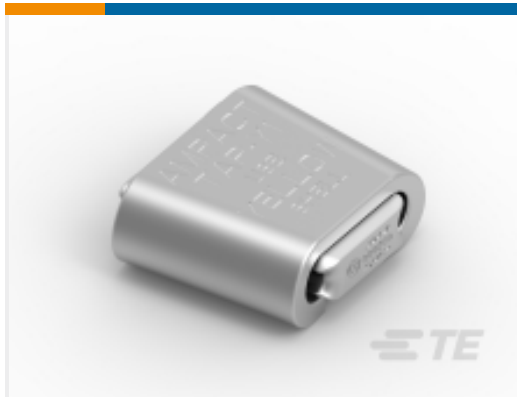
TE 产品编号83861-1 AMPACT TAP 1431 AAC-1272 ACSR