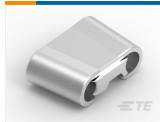
TE 产品编号1443209-1 CONNECTOR, 1351 KC MIL-636