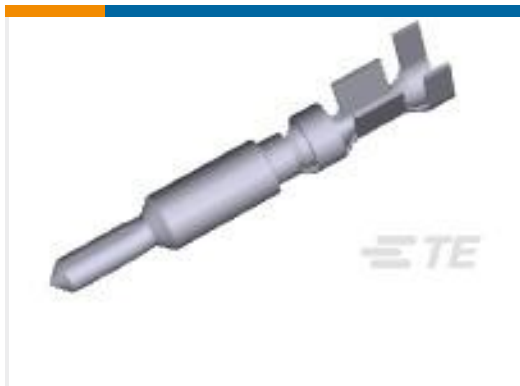
TE 产品编号1-770250-0 UMNL II PIN SN/AUNI/BR LP20-14