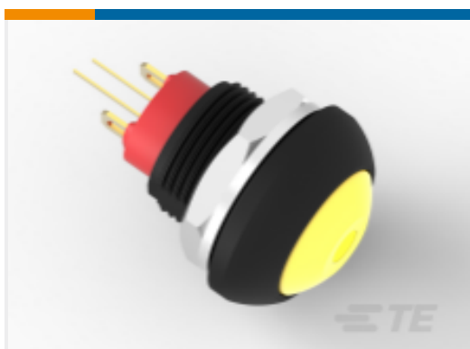
TE 产品编号1-2329387-3 PB OFF/ON FC YLW M1 TERM YLW LED IP68