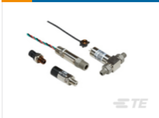
TE 产品编号10202005-00 压力传感器 (现货)