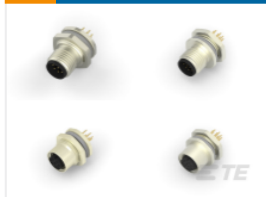
TE 产品编号T4140012081-000 M12 面板安装 PCB