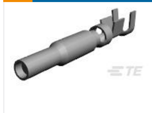
TE 产品编号1-770251-0 UMNLII SOK PTPPHBZ LP LF 20-14