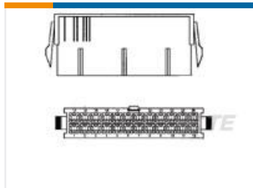
TE 产品编号2-1586018-4 24P PM PLUG VAL-U-LOK V0