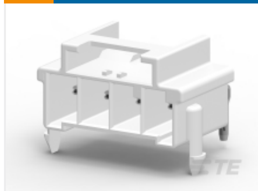
TE 产品编号1969694-4 三重锁定电源连接器标准温度接头