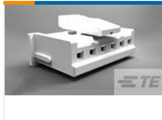
TE 产品编号1969442-3 EP 2.5 TPA Housing, 3 Pos