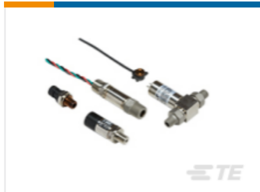
TE 产品编号10202024-00 压力传感器 (现货)