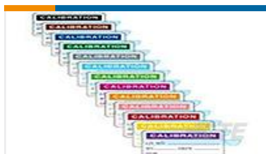
TE 产品编号1878663-5 OCC311RD