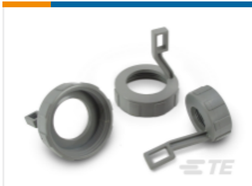
TE 产品编号M902-2194 DEUTSCH HD10 后盖