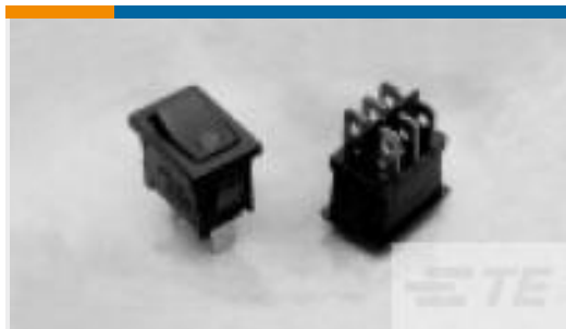
TE 产品编号1571092-1 PRBSB1-16F-BR000=POWER ROCKER