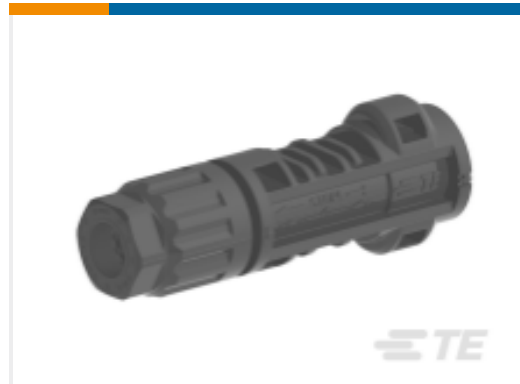
TE 产品编号1971903-1 SOLARLOK PV4-S 直流压连接器