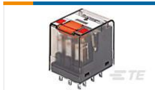
TE 产品编号2-1415529-1 PT320615