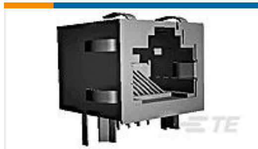
TE 产品编号1-1775365-4 MOD JACK, RJ45, SHIELD,50u" Au, L=2.05mm