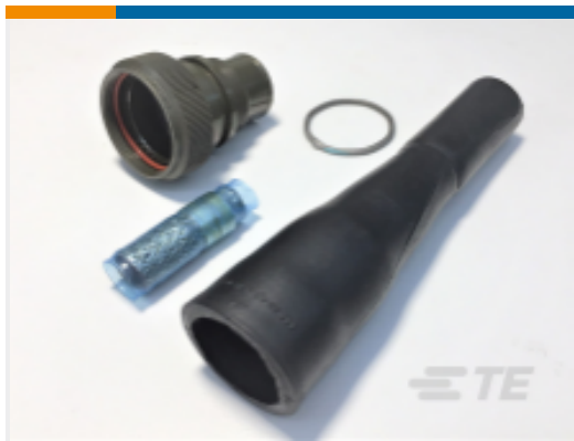
TE 产品编号254603-000 3024-10-561422-CS2359