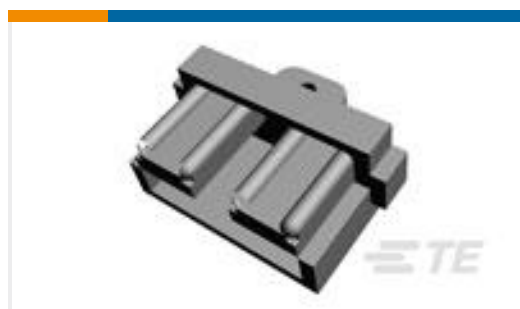
TE 产品编号1744077-1 DUST COVER,SERIES 50