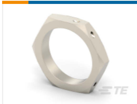
TE 产品编号2-329631-0 JAM NUT, PLATED