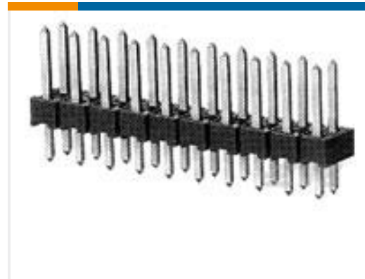
TE 产品编号3-102977-6 72 MODII HDR DRST B/A .100CL