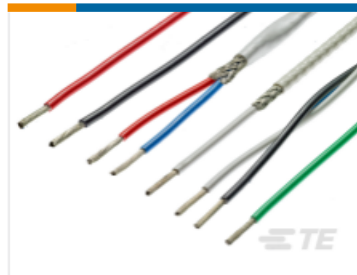
TE 产品编号240275-000 44AM4121-18-9/96-9CS2275