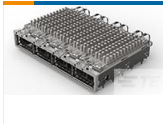
TE 产品编号2170567-2 1x4 QSFP Kit Assy LP&HS, Customized HS