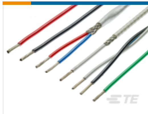
TE 产品编号334291-000 44AM4121-14-9/96-9CS2275