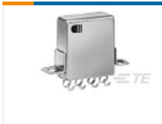
TE 产品编号1617014-3 3SAT1303A2 = M5757/13-086