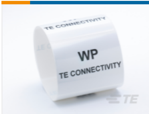
TE 产品编号F77590-000 WP 白色聚酯标签