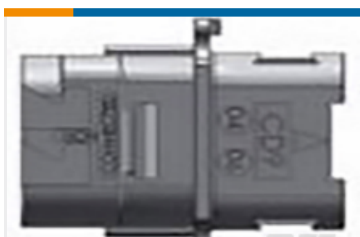
TE 产品编号ZPF000000000148532 DMC-MD 26 B-T