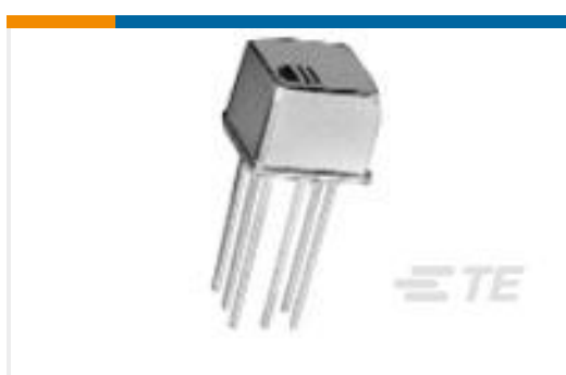
TE 产品编号1617155-1 MGAP-26 = MGA .100 GRID RELAY