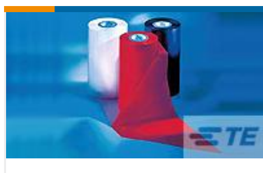
TE 产品编号143060-000 1330-0600-10