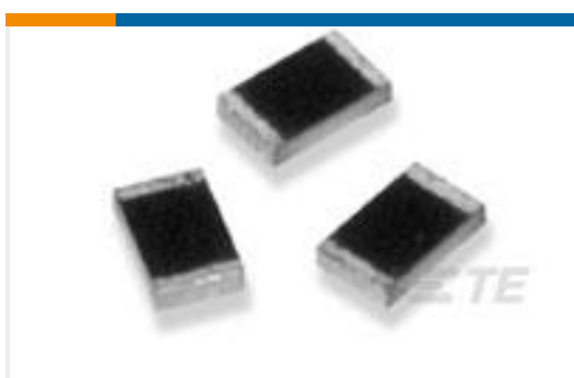
TE 产品编号2-1879254-8 RP 2B 28R7 0.1% 15PPM CUT LENGTH