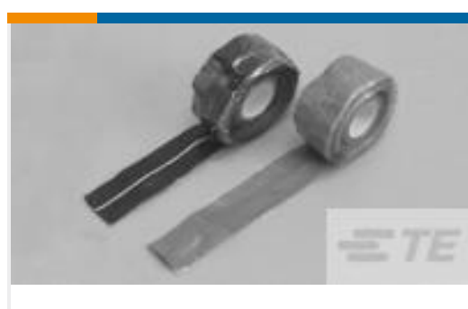
TE 产品编号1-608036-4 SILICONE FUSION TAPE,1"X15'