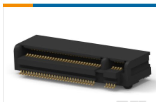
TE 产品编号1-2199119-5 M.2 连接器