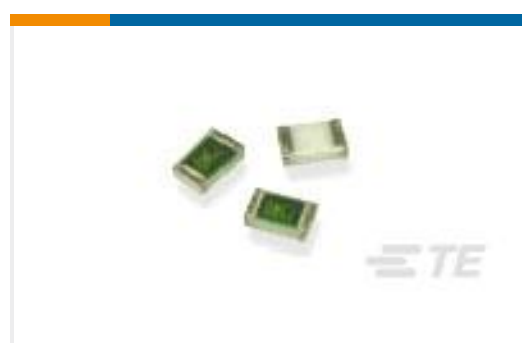
TE 产品编号1676399-1 RN 0805 63K4 0.1% 10PPM CUT LENGTH