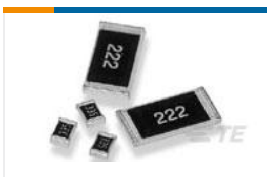
TE 产品编号1623010-1 CRG0603 1% 91K