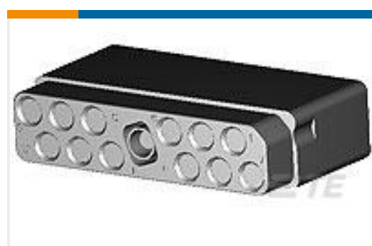
TE 产品编号1604800-5 Plug Kit, 12 Pos Quadrax