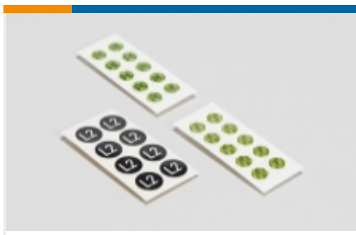
安全符号和电气符号(68)