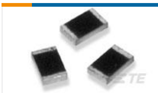
TE 产品编号4-1879744-2 RP 1J 137R 0.1% 15PPM CUT LENGTH