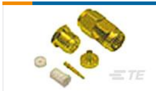
TE 产品编号1-1478908-0 SMA STR PLG S/CLMP RG174 GSS