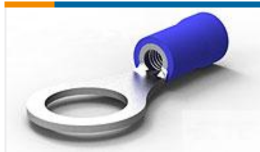
TE 产品编号34163 TERMINAL, PG R 16-14 5/16