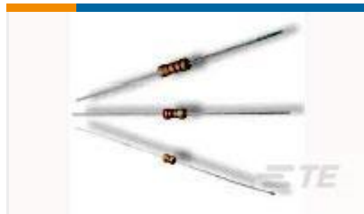
TE 产品编号2-1623930-7 CFR25 5% 18K