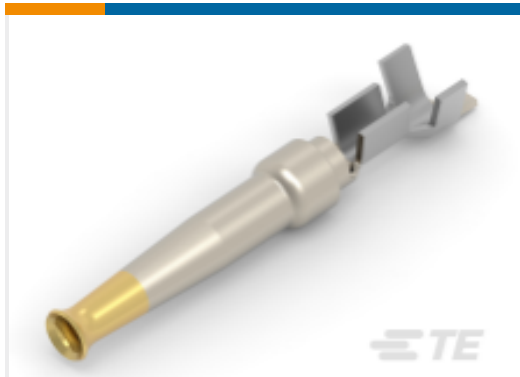
TE 产品编号5-166051-1 D-Sub Conn Contacts: Socket, Phosphor Bronze, Signal, Size 20