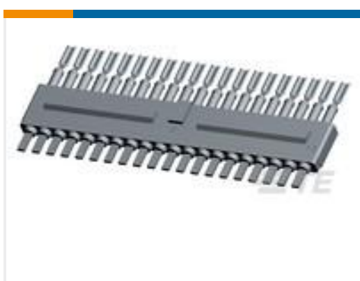
TE 产品编号699219-000 MTCB2X-XXX-205