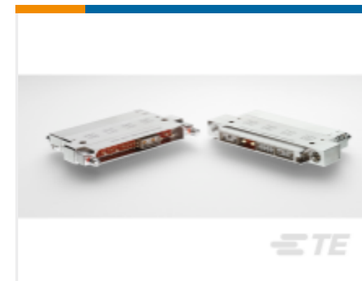
TE 产品编号ABC23H-0000 RECP ASSY