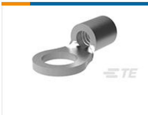
TE 产品编号1958125-1 Kit 12-10, #10, NI, +RT-555-1/4X1