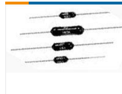
TE 产品编号2-1879619-4 H8 91R 1% 25PPM