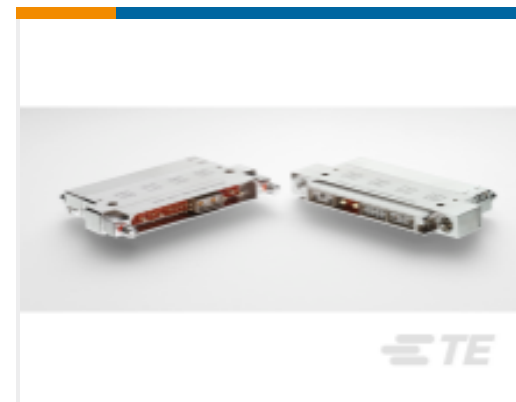
TE 产品编号ABC16H-7000 PLUG ASSY