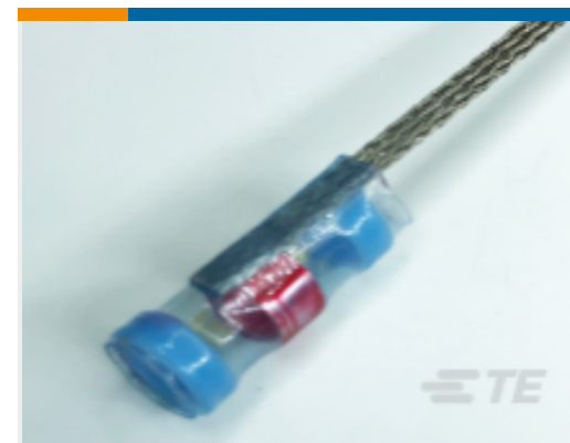
TE 产品编号CP4265-000 S200-1-02-TC