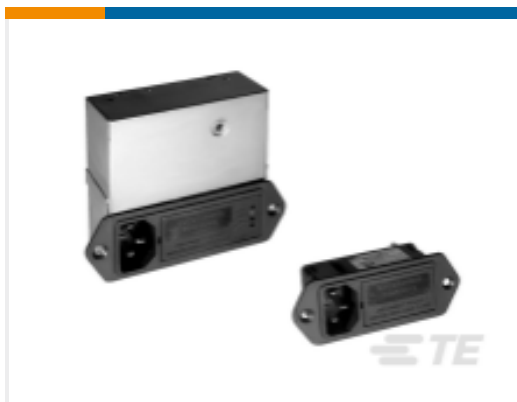
TE 产品编号3-6609128-4 CORCOM M 系列多功能插口式滤波器