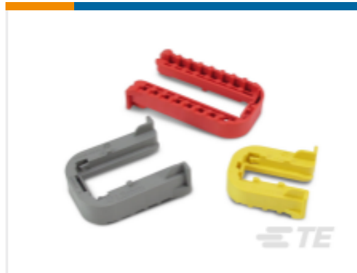
TE 产品编号1564411-5 重载连接器固定滑块