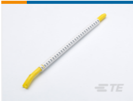
TE 产品编号122028-000 STD 搭锁式标志