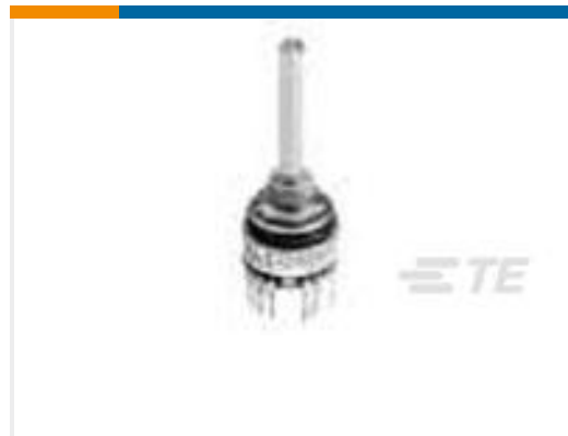
TE 产品编号1825537-2 MRJE2604