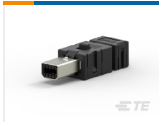
TE 产品编号1-2201855-1 Mini I/O 光缆连接穿孔 D2