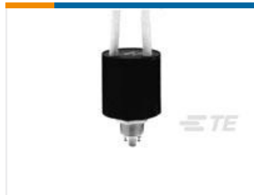
TE 产品编号6-1618404-0 K62A971=Relay, Vacuum, SPST NO