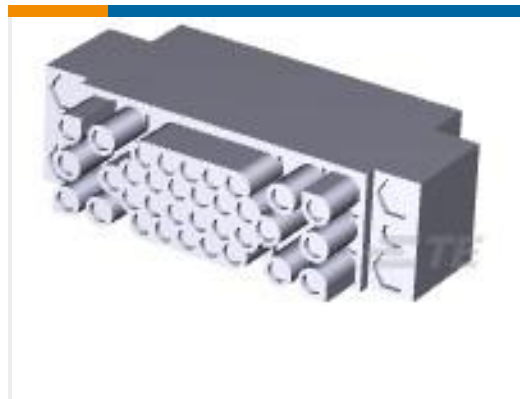
TE 产品编号926500-1 34P SER M GEHAEUSE