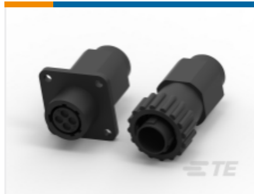
TE 产品编号796272-1 CPC 系列 1 密封一体式