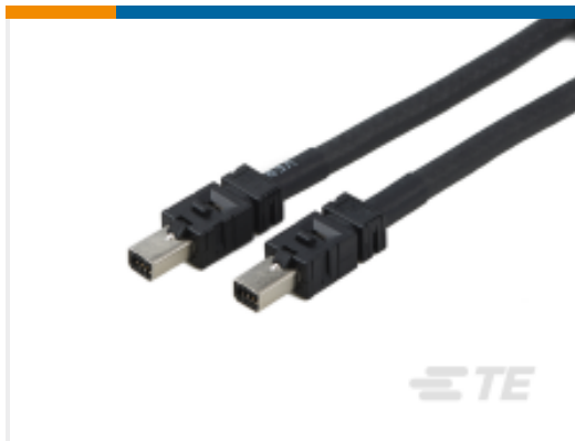
TE 产品编号2-2205132-3 CA MINI IO MINI IO TYPE II