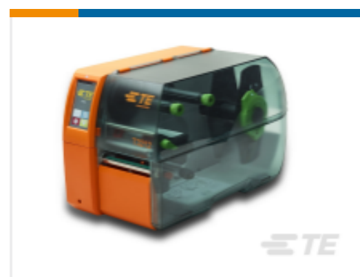
TE 产品编号 1-2186500-1 T3212-PRINTER