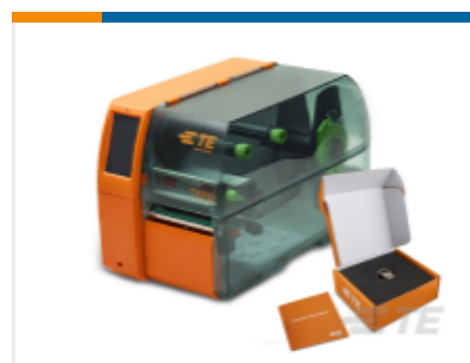
TE 产品编号 1-2186501-1 T3212-SWARE-PRINTER