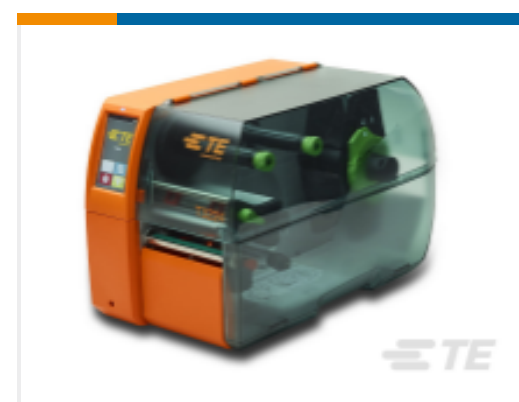
TE 产品编号 1-2186502-1 T3224-PRINTER