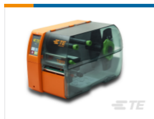
TE 产品编号 1-2186500-1 T3212-PRINTER