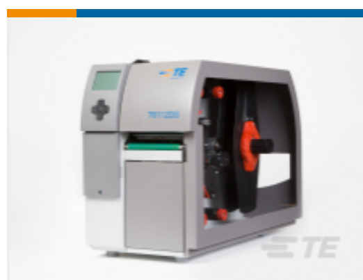
TE 产品编号 CP8122-000 T6112DS-PRINTER