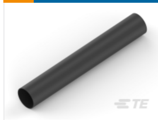
TE 产品编号NB12034001 ATUM-9/3-0-SP