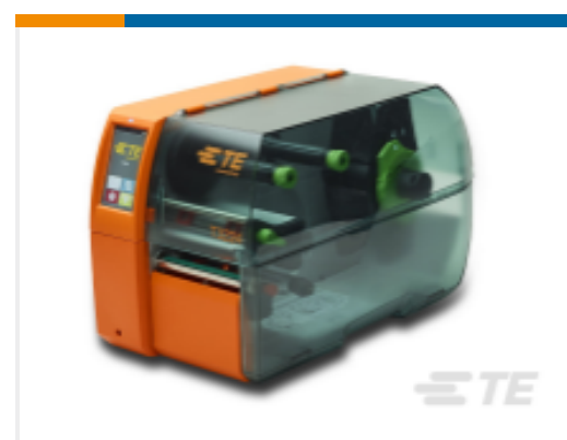
TE 产品编号 1-2186502-1 T3224-PRINTER