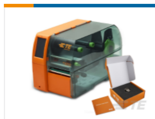
TE 产品编号 1-2186501-1 T3212-SWARE-PRINTER